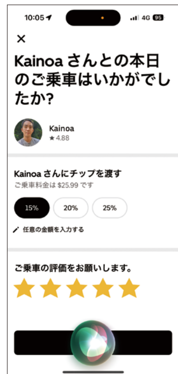
Uberはチップ15%以上? (拒否もできますが)