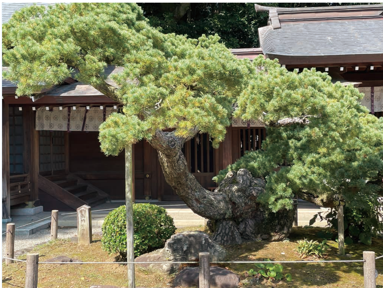
いずみ 出水神社（水前寺公園）五葉の松

〒604-0943 京都市中京区麩屋町通御池上ル 上山町258-2 TEL (075) 222-2311 E-mail kyozei@kyozei.or.jp