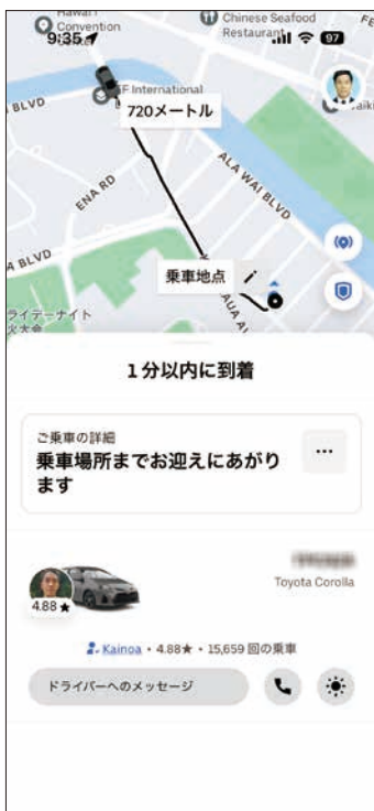
GPSでどこにUberがいるかが一目瞭然