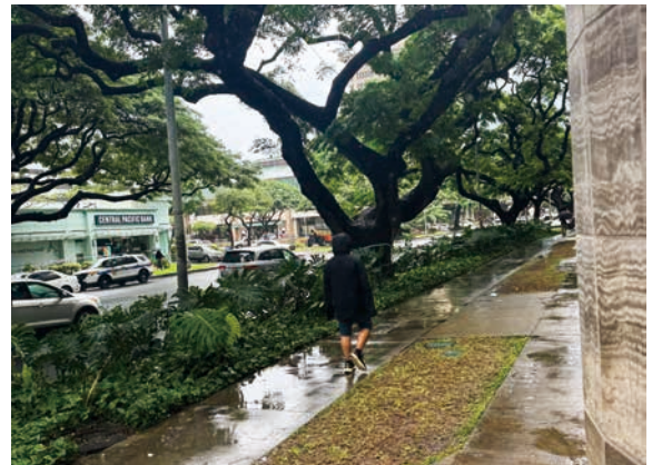
雨でもあまり傘はさしません