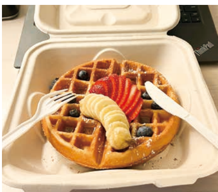
アメリカでもテイクアウトはありました

日本で一般的になったテイクアウトはハワイにもありました。「Take Out OK」という看板はチラホラ見かけましたので、日本同様にテイクアウトも存在感が増している印象でした。