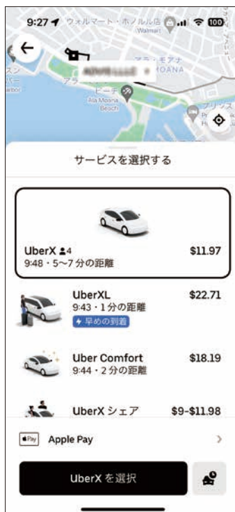
Uberなしでは移動できません