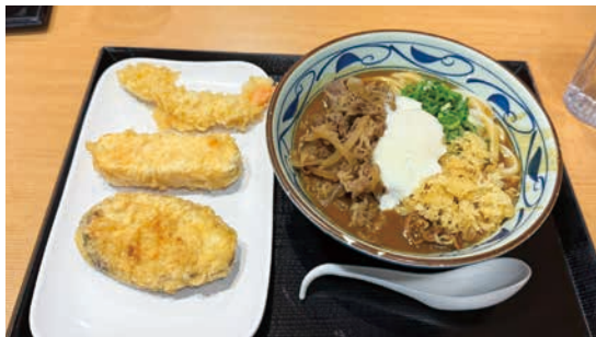
丸亀製麺は30分は並びます

文化の違い、でいうと「雨でも傘をささない」文化にも少し驚きました。そもそも現地でスーツを着ている人が皆無で、みなカジュアル（アロハシャツが正装）のため、濡れることを気にしないのでしょうか、傘をさしている人は皆無です。日本の大量のビニール傘の文化は特殊なものなのかもしれません。