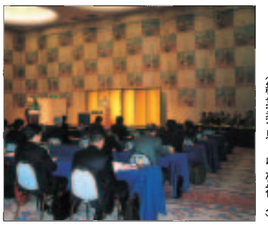
(編集委員 中村裕人)