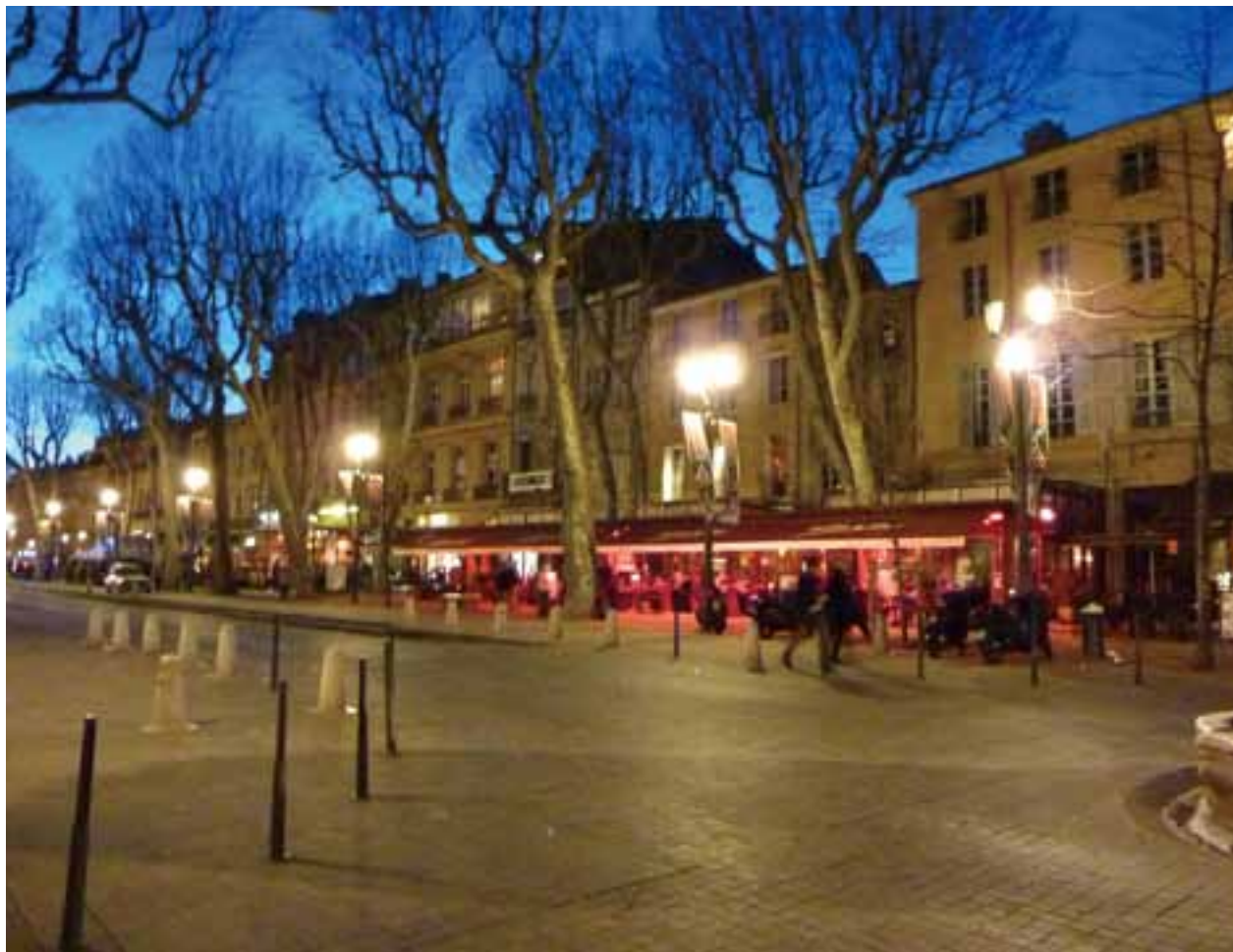
ミラボー通りのレストラン（南仏・エクサンプロヴァンス）

〒604-0943 京都市中京区麩屋町通御池上ル 上山町258-2 TEL(075)222-2311 E-mail kyozei@kyozei.or.jp