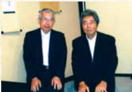
(細川元総理大臣と) 細川氏の陶芸展会場で

2年ほど前に友人の紹介で毎月第3日曜日の午後、京都駅前の“場所”で「小さなしあわせさがそう会」という名の同好会に出席しています。