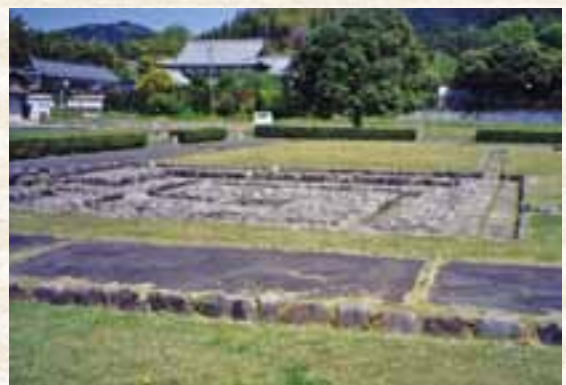
伝 板蓋宮跡(明日香村)