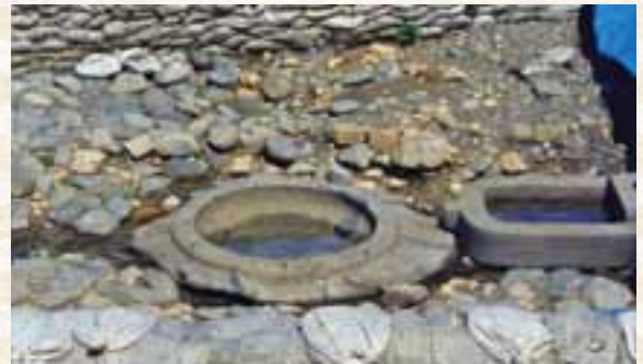
齊明朝・亀石遺跡(明日香村)

2年ほど前に友人の紹介で毎月第3日曜日の午後、京都駅前の“場所”で「小さなしあわせさがそう会」という名の同好会に出席しています。