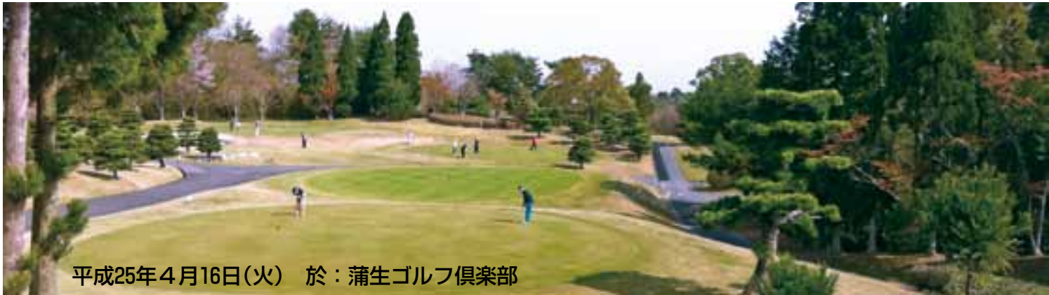
平成25年4月16日(火) 於：蒲生ゴルフ倶楽部