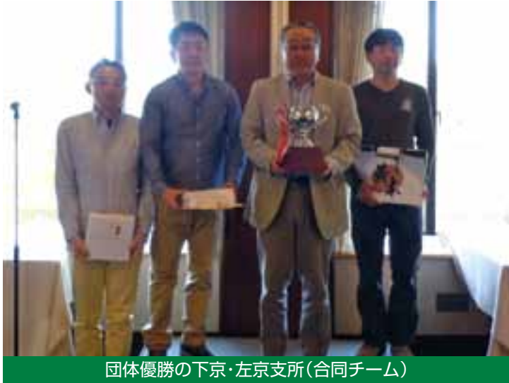
団体優勝の下京・左京支所(合同チーム)