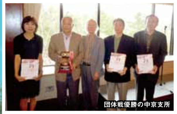
団体戦優勝の中京支所