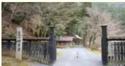
「美山荘」入口と「峰定寺」入口 「阿美寮」はこの辺りにあったと言われる

…緩やかな上り道を十五分ばかり進むと、その入口には「阿美寮・関係者以外のお断りします」という看板が立っていた。