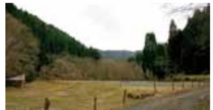
「峰定寺」に隣接する野原

…緩やかな上り道を十五分ばかり進むと、その入口には「阿美寮・関係者以外のお断りします」という看板が立っていた。