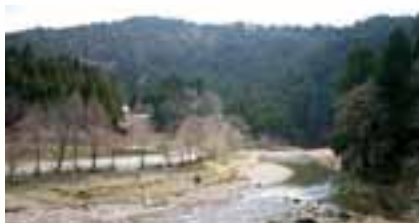
「大悲山口」バス停付近

…停留所の標識がぼつんと立っていて、小さな川が流れていて、登山ルートの入り口があるだけだった。