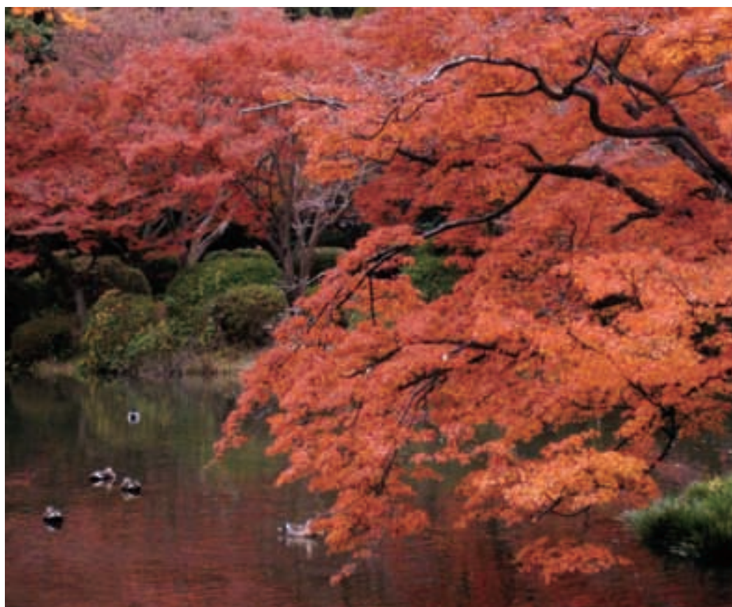
なからぎの森（京都府立植物園） 上京支所 馬場 佳代子