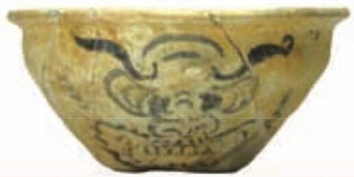
人面墨書土器 (京都市埋蔵文化財研究所所蔵)

城を後にし、次の観光地堀川今出川までぶらぶらと歩いて行こう。堀川通を北に行くと堀川商店街