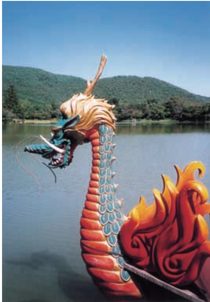
大覚寺 大沢池「龍頭船」 右京支所 九鬼 郁雄