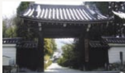
随心院 境内には、化粧の井戸など小町ゆかりの遺跡あり

日野の山を降りて小野随心院に向かった。随心院は優れた歌人であり絶世の美女といわれた小野小町が住んでいた屋敷跡と伝えられている。