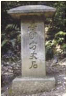
長明方丈石 方丈の庵を作った長明の心境は「老いた翁の語を営むがごとし」とある。