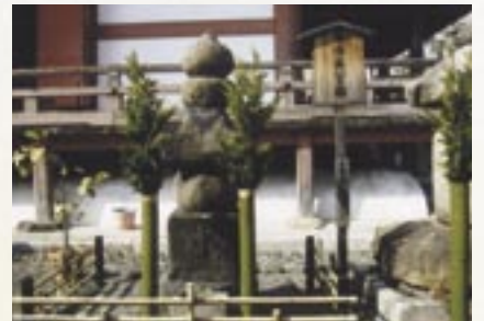
平清盛の塚 六波羅蜜寺の清盛坐像は「清盛の傲慢さはなく、仏者としての気品を覚える」とある。

第七の徳目「ひたすら思慮深くあるべきこと」の中の一説話。この好例として平清盛の穏やかな人柄、こまやかな気配りを取り上げ、思慮の大切さを強調している。