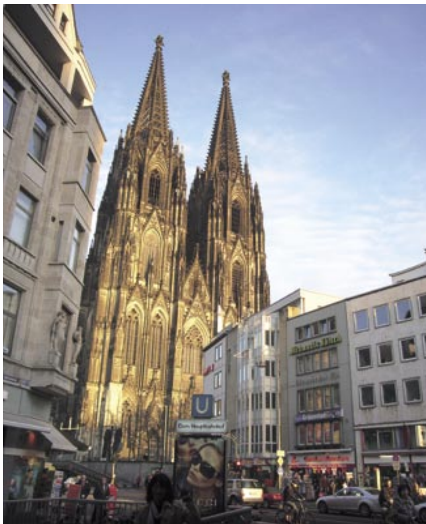
夕映えのケルン大聖堂（ドイツ） 広報委員 有田行雄