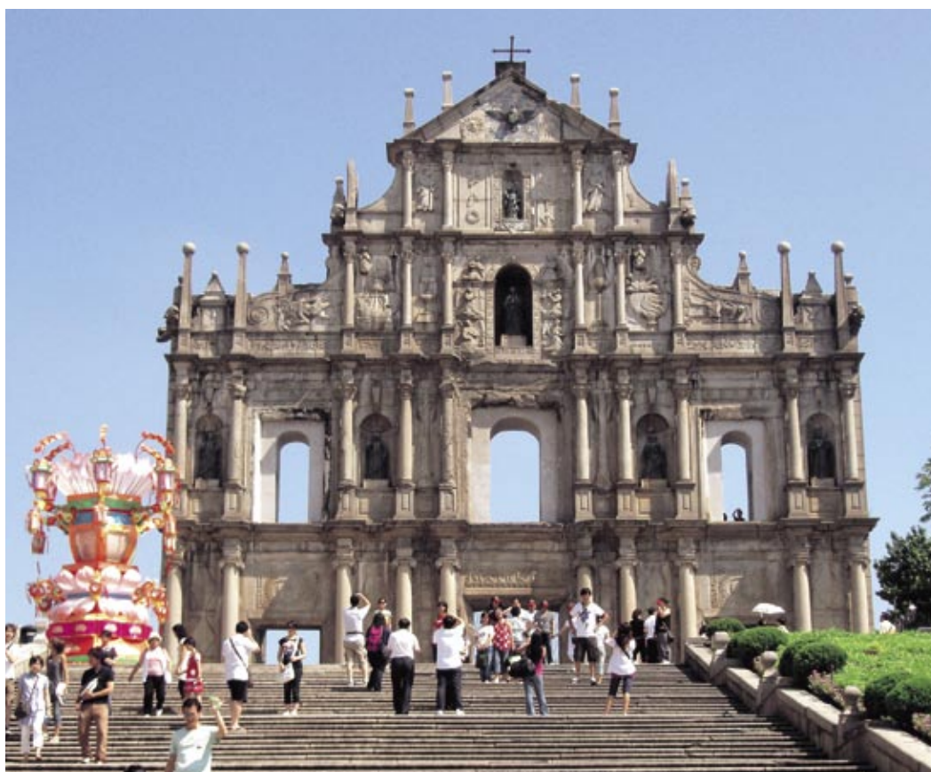
セントポール 天主堂跡（マカオ）