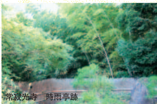
常寂光寺 時雨亭跡

晩秋の小雨のように通り過ぎた恋一時雨の恋一定家の時雨亭がこの「時雨の記」という題名の由来です。