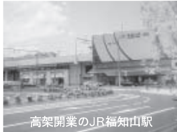
高架開業のJR福知山駅

た。平成18年1月1日には、近隣の三和町・夜久野町・大江町と合併し、面積が552.57km 2 、人口が約8万4千人となる新しい福知山市がスタートしました。