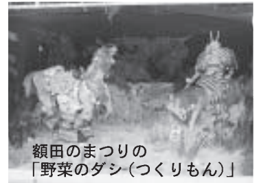
額田のまつりの「野菜のダシ(つくりもん)」

日本を代表する漫画家である松本零士先生は、子供の頃その本を読まれ感動。後に漫画家となら