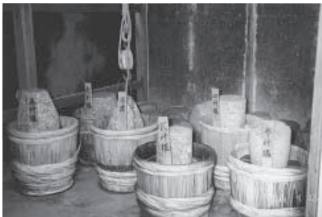
最優秀賞 峰山支所 林 同来先生「塩田王の野崎家」