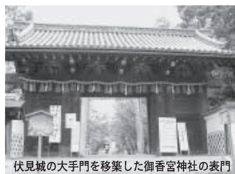
伏見城の大手門を移築した御香宮神社の表門

表門は伏見城の大手門を移築したもので、桃山期の貴重な遺構になっています。そのほか、少し境内を散策すると樹齢約400年の椿の古木が見つかります。この椿は、豊臣秀吉が伏見城築城の際、各地から集めた茶花の一つと伝えられています。