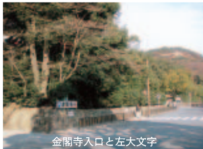
金閣寺入口と左大文字

頃、金閣寺裏の左大文字においてカルモチンを服毒、自殺を試みたがこれに失敗し、苦しんでいるところを発見され逮捕された。警察の取り調べに対し「美に対する嫉妬と自分の環境の悪さから、金閣と心中する覚悟で火を付けたが怖くなって裏山に逃げた。金閣が燃え上がるのを見て薬を飲んだが死に切れなかった」と自供。舞鶴から出て来た林の母親は事情聴取を終え、帰郷途中の山陰線の列車から保津峡に身を投じた。