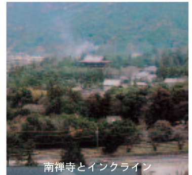
南禅寺とインクライン

『金閣を焼けば……。その教育的効果はいちじるしいものがあるだろう。そのおかげで人は、類推による不滅が何の意味ももたないことを学ぶからだ。ただ単に持続してきた、五百五十年のあいだ鏡湖池畔に立ちつづけてきたということが、何の保証にもならぬことを学ぶからだ。われわれの生存がその上に乗っかっている自明の前提が、明日にも崩れるという不安を学ぶからだ』。