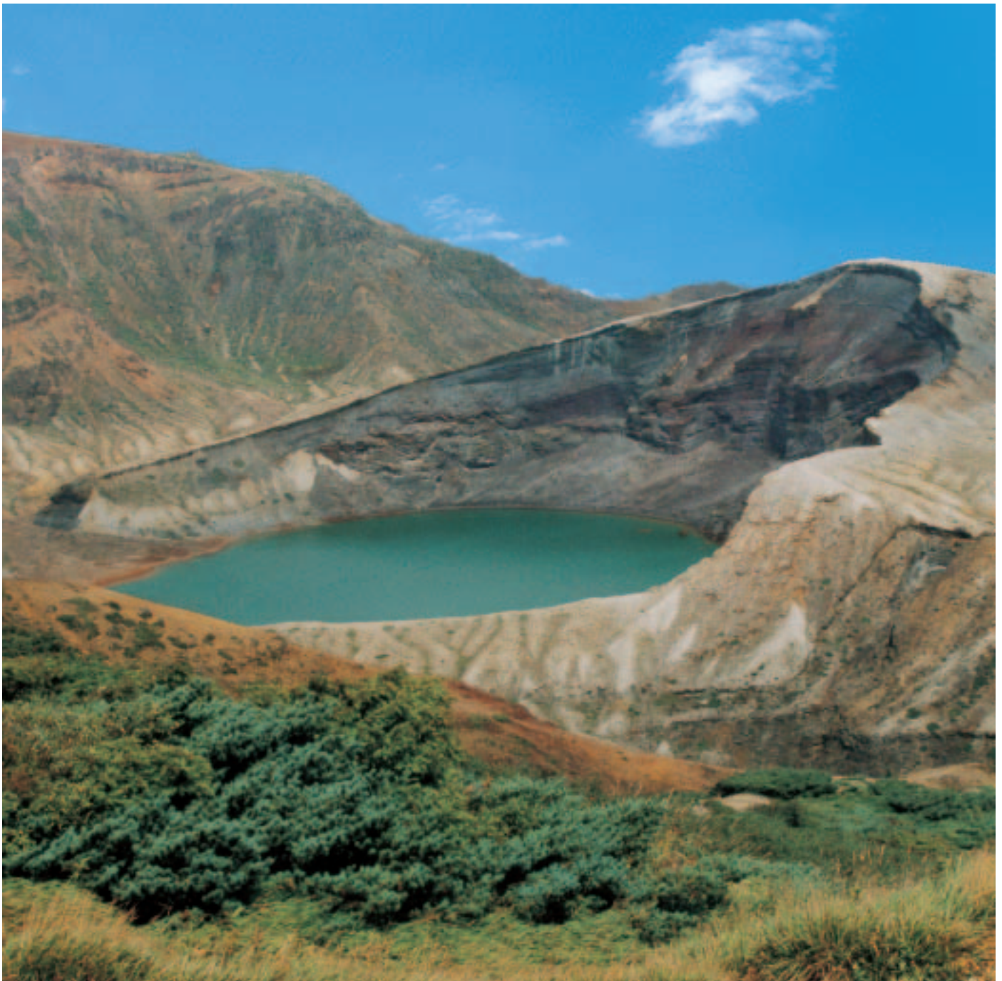
蔵王のお釜 編集委員 北 尾 剛 久

発行所 京都税理士協同組合 発行人 上 田 寛 編集人 井 上 玲 子 〒604-0943 京都市中京区麩屋町通御池上ル 上白山町2 5 8-2 電話(075)222-2311 E-mail kyozei@kyozei.or.jp