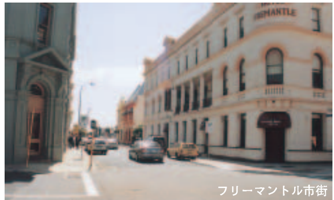
フリーマントル市街

美しい空、紺碧の海、鮮やかなワイルドフラワーの赤や紫、真白い砂の丘、そして可愛らしい動物達と、何もかもが珍しく感動的なパースの旅は、心に残る思い出をたくさん残してくれました。自然の力の何と驚異的なこと。ピナクルスでは悠久の時の流れに人間の一生の短さを感じました。市内では無料のバスに乗せてもらい、何と良いシステムなのかと感心、御世話下さった先生方、そして同行して戴いた皆様に心より感謝申し上げます。ありがとうございました。