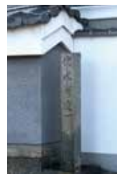
伏水街道一之橋旧趾

にある通天橋などが架かっています。そしてここから北へ進むと九条通高架下に「伏水街道第二橋」の親柱がありました。二ノ橋川が昭和三年に都市計画によって廃川となったため今は親柱のみ保存されています。そして第二橋より徒歩5分ほど北へ行くと宝樹寺の北辺に伏水街道一之橋旧趾という石碑がありました。第一橋は伏見街道の今熊野川