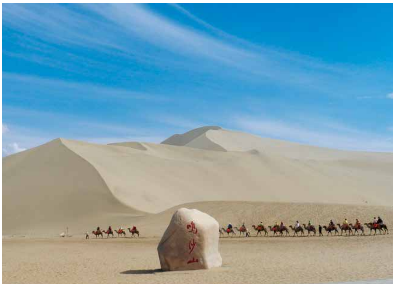
シルクロード鳴沙山（中国／敦煌）

〒604-0943 京都市中京区麩屋町通御池上ル 上山町258-2 TEL(075)222-2311 E-mail kyozei@kyozei.or.jp