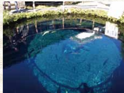
忍野八海の湧水口

御殿場から北へ走り山中湖を過ぎて忍野村へ入ると、湧水群のひとつである忍野八海があります。かつて存在した忍野湖が干上がり、八つの湧水口が池として残ったもので富士山信仰の巡礼地として世界文化遺産に登録されています。それぞれの池に趣がありますが、なかでも水深8メートルの湧水口は底まで見えるほどの透明度で、覗き込むと畏怖さえ感じます。