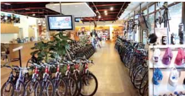
レンタサイクルショップ

さて、ここ日月潭では台湾の有名自転車メーカーである「GIANT」のレンタサイクルショップがあり、ここで自転車をレンタルして日月潭を一周（約30km）するというのが流行っているそうです。