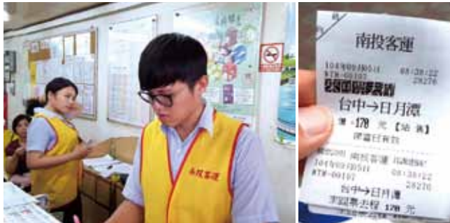
南投客運チケット売場