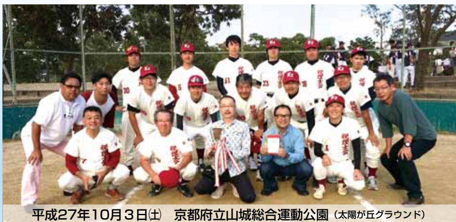
平成27年10月3日(土) 京都府立山城総合運動公園 (太陽が丘グラウンド)