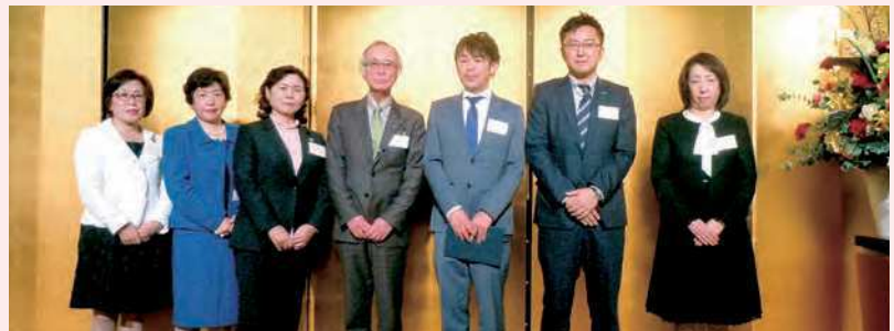
【受賞者の方々】(敬称略)