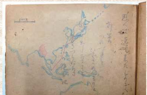
昭和22年 ビルマコカインJSP収容所にて書き連ねた日記の原本