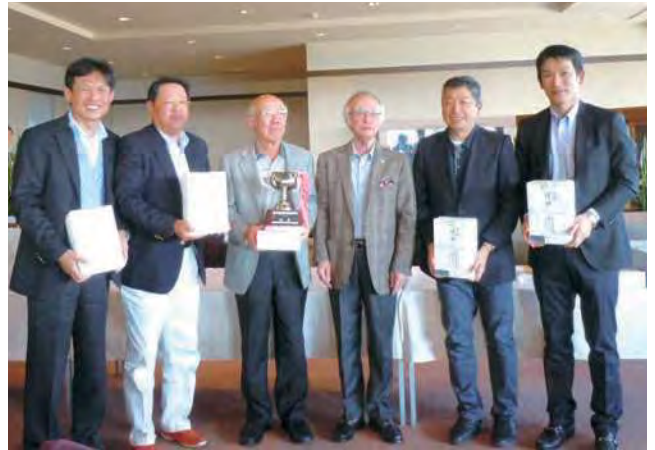
団体優勝 伏見支所