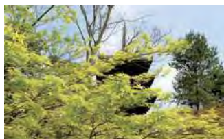
新緑鮮やかな仁和寺

御室桜は樹高が2メートル程と低い桜で、江戸時代頃から庶民の桜として親しまれてきたそうです。京都の春を彩る最後の桜とも言われています。