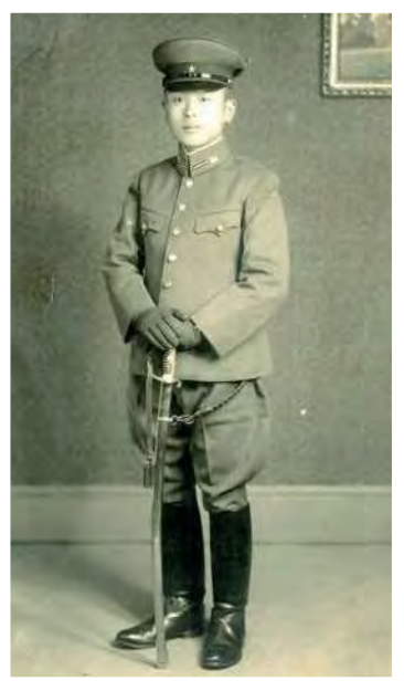
昭和16年11月 少尉任官時

やがて銃撃が終わったようだ。脱兎の如く家に飛び込んで閣下の手提げ鞆、軍刀、眼鏡、拳銃と手あたり次第目ぼしいものを掴み出す。取敢えず壕の中へ持ち込むように命じ、壕の側