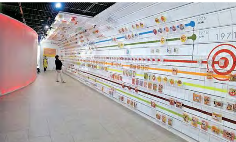
インスタントラーメン発明記念館

あっという間の楽しい2日間、初日の家島のじゃこ鍋、これはすごかった。地元の魚を食べつくす・おいしかったの一言。最後のぞうすいまで余すところなく完食、ごちそうさまでした。最後に一言、皆様お世話になりました。