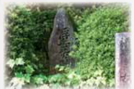
浮舟の古蹟(三室戸寺)

身を投げようと宇治川をさまよい宇治の院の森に倒れていた浮舟は、横川の僧都に救われ、出家を果たします。