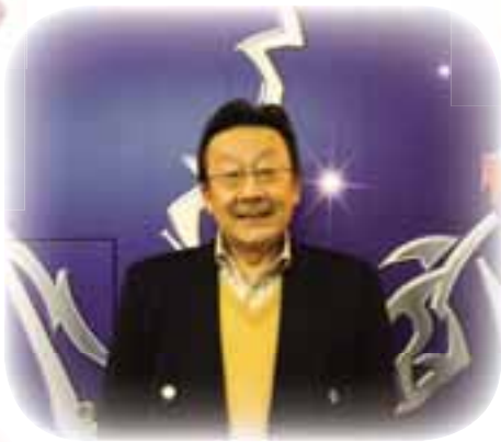
左京支所 二股 茂

恥ずかしながら、ミュージカルを初めて観劇しました。 2時間半を連続して演じる出演者のエネルギー、舞台装 置に驚きました。このような機会があればまた観劇したいで すね。