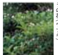
ほのかににおう、うの花(ウツギ)