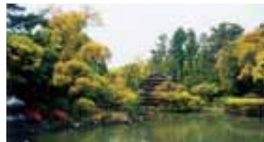
青大将の住む九条池