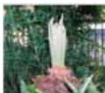
新芽を吹き上げる蘇鉄

税理士であった大家さんは一年前になが永の旅路に出られた。その数年前から屋上の花園の整理をはじめられた。植物の多くが植木屋へ運ばれたが、一部は地下鉄国際会館の北の地、私の離れ庵へ引き継いだ。ウツギ、