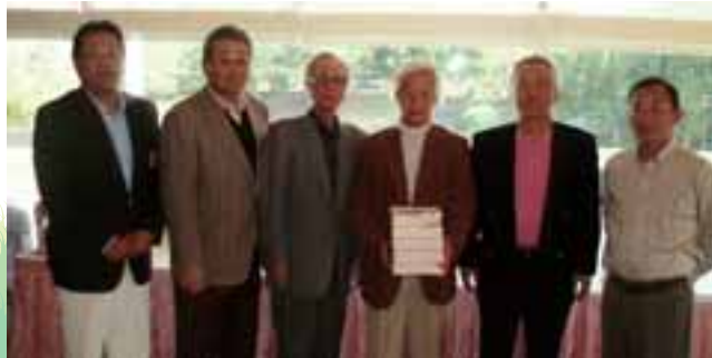
団体戦優勝チーム