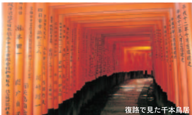
復路で見た千本鳥居

日本の青年諸君、韓国、中国、アメリカなど海外からの人たちが、賑やかにデジカメや携帯カメラでの撮影を楽しんでいます。嬉しいことに日常生活ではご縁のない彼らが私に日本語で話しかけてくれることもあります。世の中は変わりました。