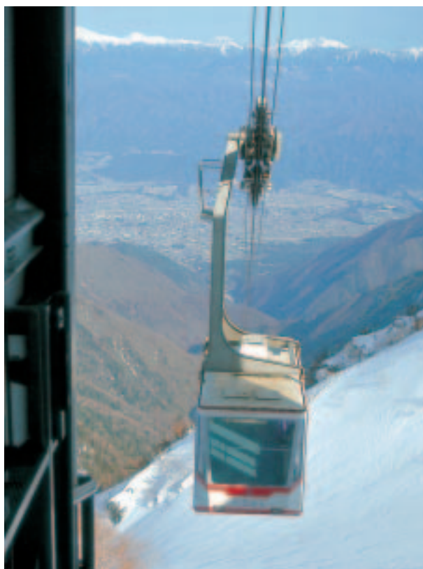
中央アルプス駒ヶ岳ロープウェイ

発行所 京都税理士協同組合 発行人 廣瀬 伸彦 編集人 有田 行雄 〒604-0943 京都市中京区麩屋町通御池上ル 上白山町258-2 電話(075)222-2311 E-mail kyozei@kyozei.or.jp