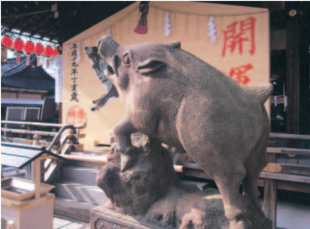
護王神社(ごおうじんじゃ)

発行所 京都税理士協同組合 発行人 廣瀬 伸彦 編集人 有田 行雄 〒604-0943 京都市中京区麩屋町通御池上ル 上白山町258-2 電話(075)222-2311 E-mail kyozei@kyozei.or.jp