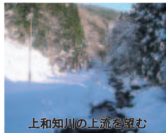
上和知川の上流を望む

バスはしばらく国道27号線を由良川に沿って京都方面に戻るが、右車窓の下を流れる川面は寒々としている。いくらも行かない内に上和知川との合流地点の篠原からいよいよ仏主への谷間へと分け入って行く。ただし道路は河岸段丘の上部を辿るので見晴しが良く、対岸の遠くまで見渡す事ができる。しかし、道路と川面の高低差がなくなる下栗野のあたりから全面の景色が狭くなってきた。それでも京都の大原くらいは谷幅がある。谷が迫ってくるのはその名の通り細谷辺りからで、川幅も10メートルも無さそう。くねくねとカーブをいくつもすぎると景色が開け、集落が現れた。終点の仏主集落に5分遅れの12時45分に到着。