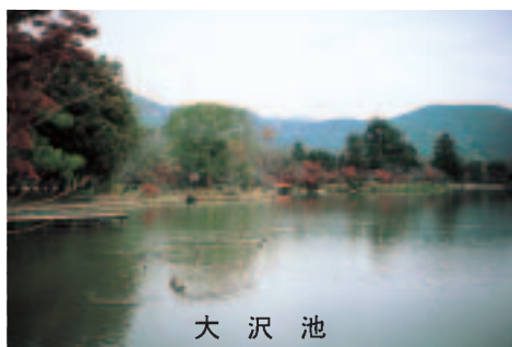
大 沢 池

私が住んでいる長岡京市は人口八万人弱の街ですが、西山の丘陵をひかえた、緑の多い街です。市内には竹藪も多く残り、京都西山のたけのことして全国的にも有名です。 阪急長岡天神の駅を降りて西の方へゆっくりと十分ぐらい歩くと、長岡天満宮があります。春は梅、桜、きりしまつじと順に咲き誇り、夏は緑、秋は紅葉と年中私たちの眼を楽しませてくれます。 今回、おすすめするのは、長岡天満宮のまわりの散歩道です。天満宮の前にある八条ヶ池には、水上の回廊もあり、遊歩道も整備されており、ちょっとした散歩には最適です。