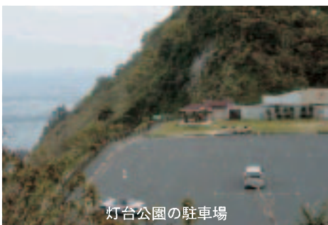
灯台公園の駐車場