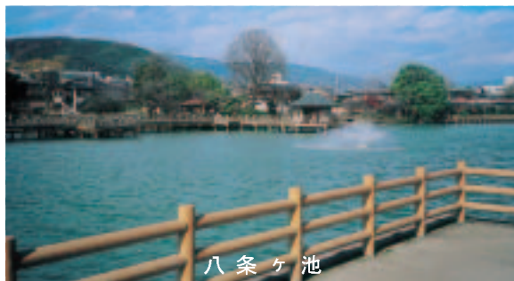
八 条 ヶ 池

ズンともなると混雑するので、ここでは、広沢方面を、ご紹介しようと思う。新丸太町通のニックボウルを北上すると、西に古いお寺、遍照寺があり、我家のお寺でもあるので遙拝しつつ北上がかる。すると右手に静かな水をたたえ、山を背に広がる大きな広沢池に達する。秋は色づく山々を写し、春には周りを桜が彩る。左手、西には、のどかな田畑が広がる。稲は初夏には青々と、秋には黄色に輝き、一面に視界を遮るものはない。かなた北方に、愛宕山を頂点に山々が並ぶ。南には京の町並が見下ろせる。右手の広沢池と左手の田畑を目にすると、ここが車の行き交う新丸太町通から歩いて十分の所とは信じられない思いにとらわれる。田畑沿いに、あせ道の草花をみながらなおも北上すると嵯峨野らしい竹藪に囲まれた道となる。別世界のように静寂な道である。西に折れる道を行って南下するとちょうど大覚寺の裏門に至る。大覚寺の庭は、大沢池を中心に広がる。桜が周りを取り囲んで植えられ、春にはことのほか美しい。早春には梅林も楽しめる。東北の角には「名古屋の滝」があり、辺りは芝生が広々と植え