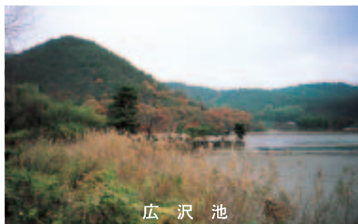
広 沢 池

我が家は嵯峨野の有栖川のそばにあり、十五分か二十分足るのぼすと、嵐山や広沢という景勝地に達する散歩道に不自由しない環境にある。 私は、愛犬トイプードルと時には妻と息子を伴い、週に一回は散歩するようにしています。私の散歩道は二ルートあり、広沢方面と嵐山方面であるが、嵐山方面は、観光シー